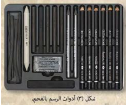
شكل (٣) أدوات الرسم بالحجم.

٢- " يتطلب الرسم بالألوان المائية مستوى عالٍ من التقنيات المختلفة " من خلال ذلك تمعن في الصورة المقابلة ثم أكتب نوع التقنية المستخدمة وماذا تعني؟